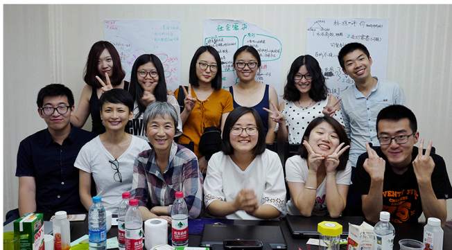
图1:第一期沙砾小伙伴