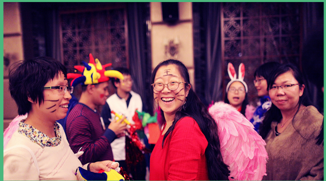
图4：银杏伙伴自己策划的晚会