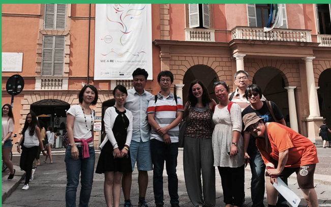
图1：银杏伙伴在意大利参观世博会米兰展馆，与国际慢食协会交流。

2015年6-7月，银杏伙伴分别前往直意大利和日本，在心平公益基金会的资助下，学习社会企业、教育发展、环境保护等内容。与国际领先的机构进行经验交流，扩展了伙伴们的视野，大家把学习所得带回到自己的事业中。