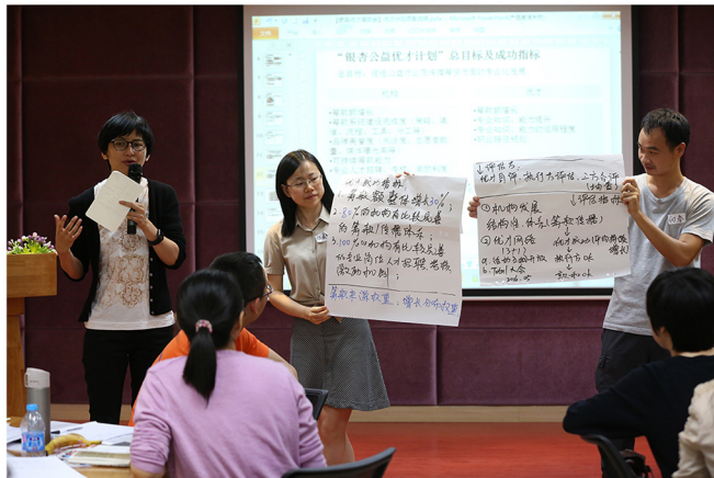
右图为优才计划在上海浦东新区举办的项目启动会暨伙伴交流会时的照片