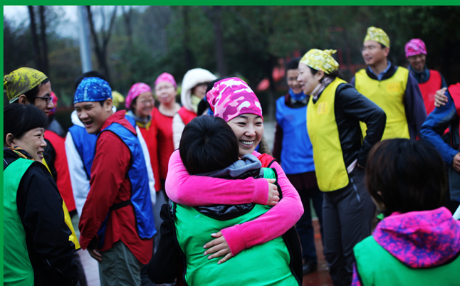
图为伙伴们参加户外团队拓展

银杏计划除了连续三年、每年10万人民币的资金支持外，还通过伙伴集体活动、海外考察等活动促进同伴间的支持与学习、开拓视野、提升协作能力。“平等、尊重、包容、开放”是银杏伙伴们共同遵从的价值。