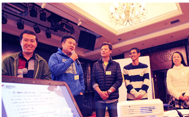
图4：第二届合作基金工作小组

从2012年开始，已经有四届银杏伙伴委员会（简称“伴委会”）为伙伴们服务。2015年，第三届伴委会承担了银杏基金会筹备过程中大量与伙伴沟通、征求意见的工作。除了伴委会外，工作小组机制也极大地促进了伙伴参与银杏网络建设。至2015年，共运行了7个工作小组，包括参与合作基金设立、春季聚会、秋季聚会、银杏基金会筹备等。共吸引了42位伙伴、62人次参加，总计约投入1401小时。