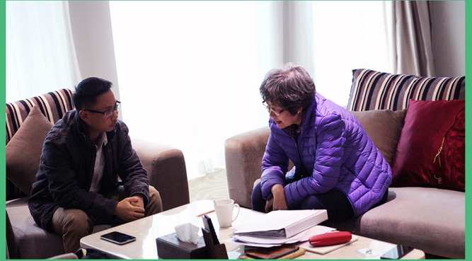
图2：评委与候选人一对一交流