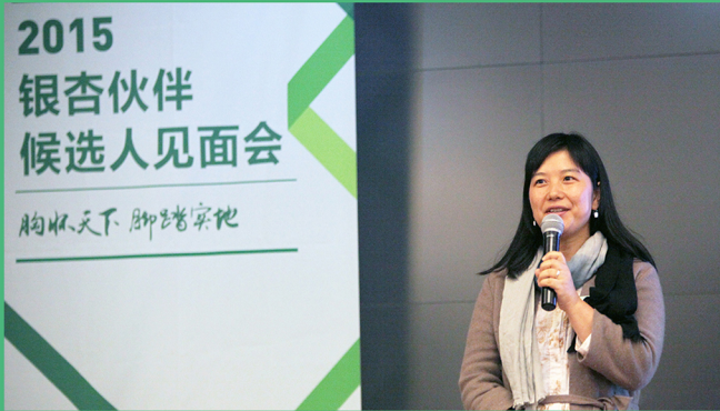
图1：候选人进行自我展示

2015年11月银杏伙伴首次年会在京举行。年会包括2015届新伙伴评审会、2010-2014届银杏伙伴聚会以及面向300名社会公众的银杏分享会。这是一场思想盛宴，伙伴们聆听导师的教诲，分享个人成长历程、机构发展经验，讨论合作，展望未来。