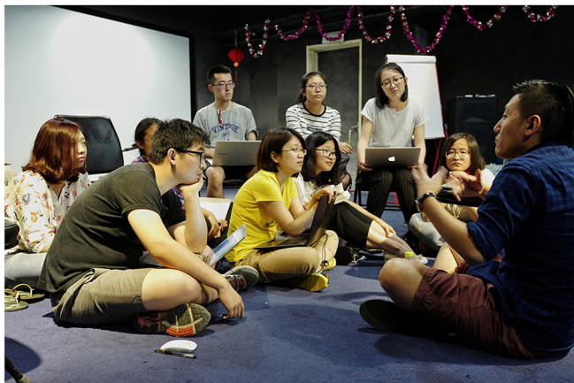
图3：沙砾挑战营讨论现场