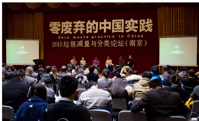
图2：2015中国零废弃联盟年会