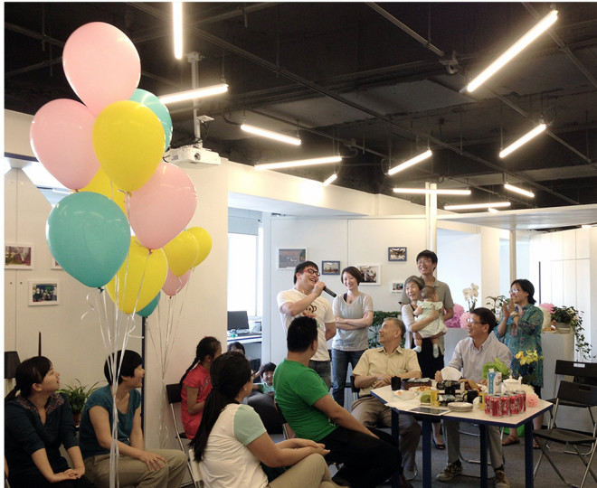
图4：11月10日，14位2015届银杏伙伴产生并公开亮相。