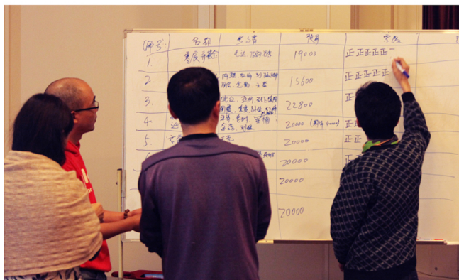
图5：合作基金投票评选

微信公众号“奴隶社会”第一年精华文集《女神·经过》作者部分的稿费捐赠给银杏计划，用于资助“公益故事写作”项目。项目目标是鼓励一线公益人写公益故事，写他们自己，写他们做的事。好故事将在奴隶社会发布，影响来自咨询、投行等领域的从业者以及海内外青年学生群体共32.5万读者，通过公益故事了解真实的中国社会和公益行动，也为有志于参与公益、提供志愿服务的读者提供参与的机会。银杏伙伴共发布了12篇文章，总点击率54万多次。