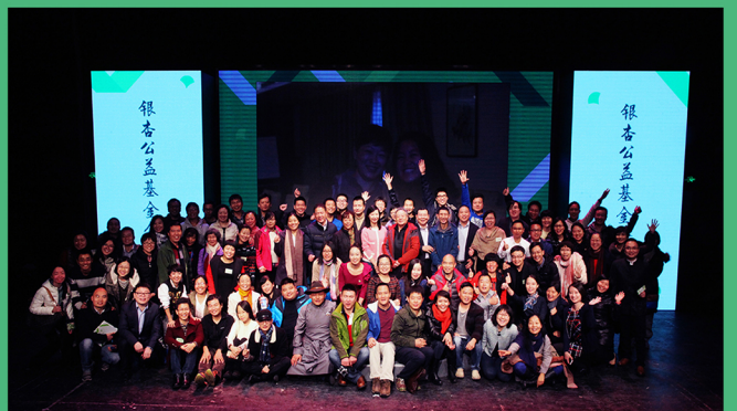
图6：银杏分享会结束后，大家合影留念。