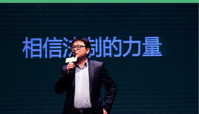
图5：银杏分享会现场