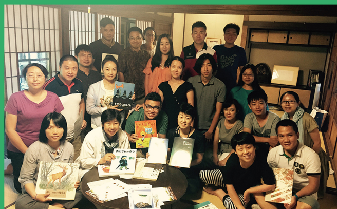
图2：伙伴们在日本参观“星星与森林的绘本之家”。